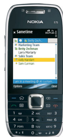
Figura 5: Dispositivo Symbian com a janela de bate-papo do Sametime aberta

O software IBM Sametime suporta colaboração em tempo real. Permite que as pessoas vejam quem está online e fornece recursos corporativos de mensagem instantânea, individual ou em grupo, para dispositivos iPhone, BlackBerry, Symbian e Microsoft Windows Mobile. O software Sametime gerencia diversas sessões ativas de bate-papo em telas pequenas e armazena e registra automaticamente essa comunicação para recuperação imediata. Agora, o software Sametime também estende reuniões online aos smartphones BlackBerry, oferecendo aos usuários opções colaborativas adicionais em tempo real.