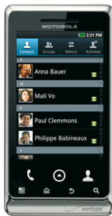
Figura 1: Dispositivo Android executando o email do IBM Notes Traveler

Os aplicativos corporativos também estão se tornando remotos. De acordo com a IBM 2010 Tech Trends Survey 2 , 57% de todos os profissionais de TI esperam que o desenvolvimento de aplicativos remotos de software para dispositivos, como os smartphones Apple iPhone e Google Android, além de tablets, como o Apple iPad e o Research In Motion (RIM) PlayBook, supere o desenvolvimento de aplicativos de plataformas de computação tradicionais nos próximos cinco anos.