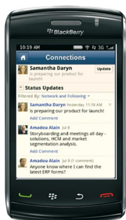
Figura 4: Dispositivo móvel BlackBerry exibindo a página inicial do Connections com atualizações de status

O software IBM Sametime suporta colaboração em tempo real. Permite que as pessoas vejam quem está online e fornece recursos corporativos de mensagem instantânea, individual ou em grupo, para dispositivos iPhone, BlackBerry, Symbian e Microsoft Windows Mobile. O software Sametime gerencia diversas sessões ativas de bate-papo em telas pequenas e armazena e registra automaticamente essa comunicação para recuperação imediata. Agora, o software Sametime também estende reuniões online aos smartphones BlackBerry, oferecendo aos usuários opções colaborativas adicionais em tempo real.