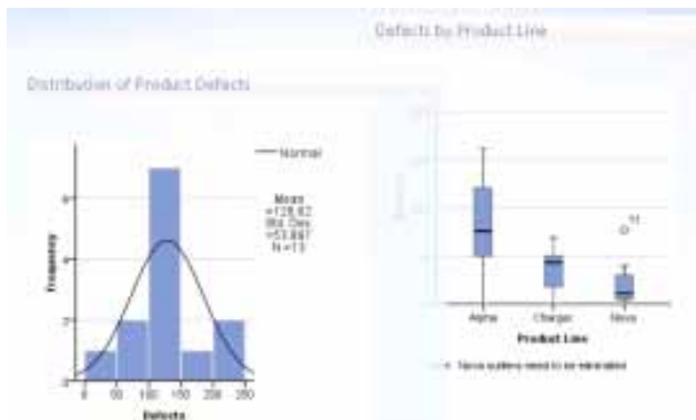
Figura 2. Visualize estatísticas e inclua-as aos seus relatórios com o Cognos Statistics