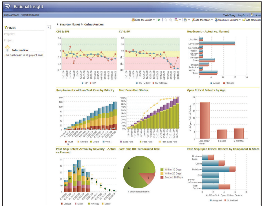
Figura 1: O Rational Insight automatiza as medições e análises de dados atuais sob demanda para aprimorar o desenvolvimento e entrega de software e sistemas.

Ao possuir essa informação vital em mãos, você pode adotar ações de aviso para correções, avaliar as razões para prazos finais perdidos, definir expectativas realistas sobre o projeto e tomar decisões mais bem informadas.