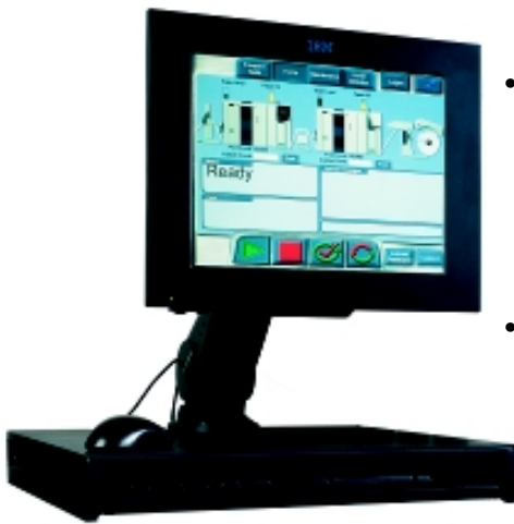
La console avanzata per l'operatore e lo schermo piatto con funzioni "touch-screen" facilitano l'uso del sistema