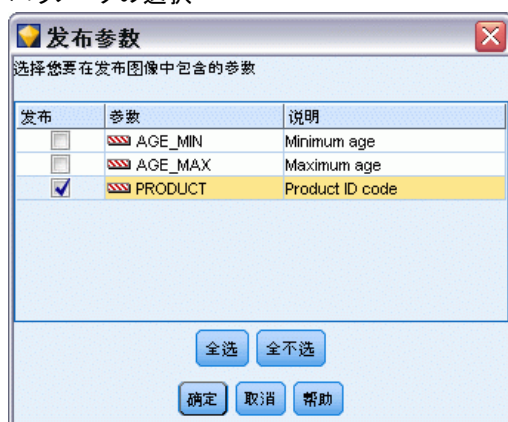
図 2-3 パラメータの選択

[公開] 列の関連するチェック ボックスを選択して、公開されたイメージに含めるパラメータを選択します。