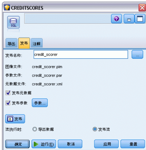
図 2-2 [公開] タブ