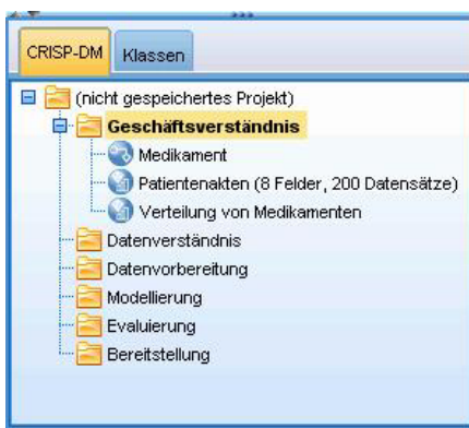
Abbildung 2. CRISP-DM-Projekttool

Das CRISP-DM-Projekttool gewährt einen strukturierten Ansatz beim Data-Mining, der den Erfolg Ihres Projekts sicherstellen kann. Es ist im Grunde genommen eine Erweiterung des standardmäßigen IBM SPSS Modeler-Projekttools. Sie können sogar zwischen der CRISP-DM-Ansicht und der Standardklassenansicht umschalten, um Ihre Streams und Ausgaben nach Typ oder nach CRISP-DM-Phasen organisiert anzuzeigen.