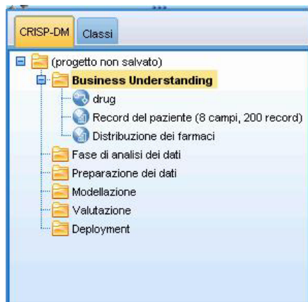
Figura 2. Strumento per i progetti di CRISP-DM

Lo strumento per i progetti di CRISP-DM garantisce un approccio strutturato al data mining per assicurare la riuscita del progetto. Tale strumento rappresenta essenzialmente un'estensione dello strumento per i progetti standard di IBM SPSS Modeler. È infatti possibile passare dalla visualizzazione CRISP-DM alla visualizzazione Classi standard per verificare l'organizzazione di stream e input in base alle fasi CRISP-DM o al tipo.