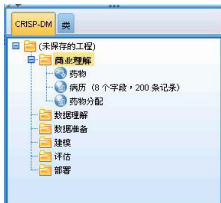
图 2. CRISP-DM 项目工具

CRISP-DM 项目工具提供了一种结构化的数据挖掘方法，有助于确保项目成功。它实际上是标准 IBM SPSS Modeler 项目工具的扩展。实际上，您可以在 CRISP-DM 视图和标准类视图之间切换以便查看按类型或 CRISP-DM 阶段组织的流和输出。