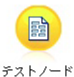
图 4. 正确显示的包含非 ASCII 字符的节点标签

使用 Python 和 Unicode 是一个非常大的主题，它超出了本文档的范围。提供了许多对此主题进行了更详细介绍的书籍和在线资源。