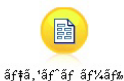
图 3. 错误显示的包含非 ASCII 字符的节点标签

标签不正确，因为 Python 已将字符串字面值自身转换为 ASCII 字符串。