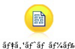
图 3. 错误显示的包含非 ASCII 字符的节点标签

标签不正确，因为 Python 已将字符串字面值自身转换为 ASCII 字符串。