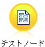
图 4. 正确显示的包含非 ASCII 字符的节点标签

使用 Python 和 Unicode 是一个非常大的主题，它超出了本文档的范围。提供了许多对此主题进行了更详细介绍的书籍和在线资源。