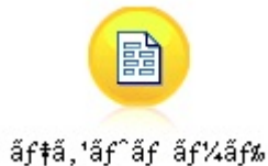
Figure 3. Libellé de noeud contenant des caractères non ASCII affiché incorrectement

Le noeud résultant aura un libellé incorrect.