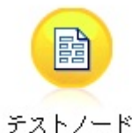
Rysunek 4. Etykieta węzła zawierająca znaki spoza zestawu ASCII, wyświetlana prawidłowo

Spowoduje to utworzenie łańcucha Unicode i prawidłowe wyświetlanie etykiety.