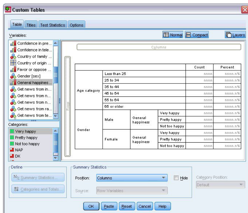
Figura 1. Cuadro de diálogo Tablas personalizadas, pestaña Tabla

Seleccione las variables y medidas de resumen que aparecerán en las tablas de la pestaña Tabla del generador de tablas.