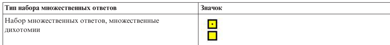
Таблица 2. Значки набора множественных ответов (продолжение)

Можно изменить уровень измерения переменной в Мастере таблиц при помощи щелчка правой кнопкой мыши по переменной в списке переменных и выбора во всплывающем меню вариантов Категориальная или Количественная . Установить какой-либо уровень измерения для переменной постоянным можно в представлении Переменные окна Редактора данных. Переменные с номинальным и порядковым уровнями измерения обрабатываются процедурой Настраиваемые таблицы как категориальные.