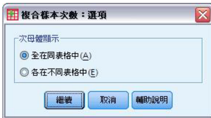
圖 5. 「選項」對話框