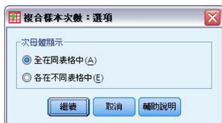
圖 7. 「選項」對話框