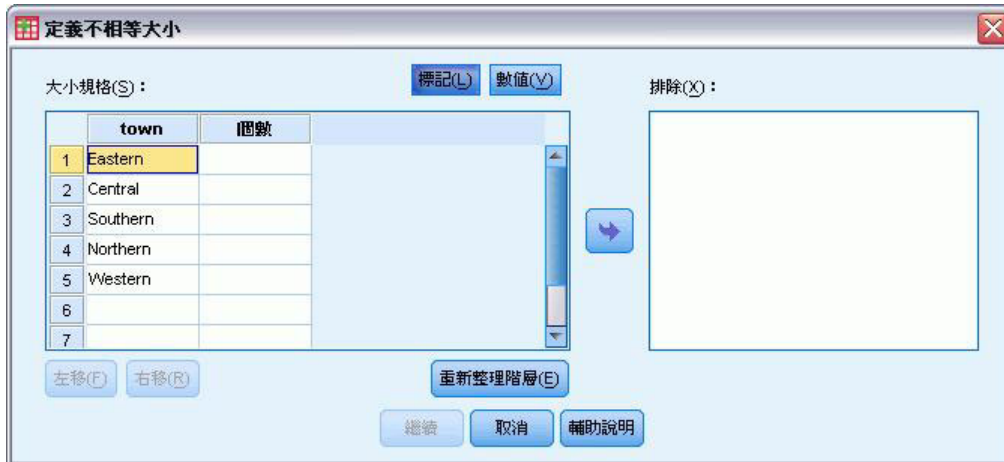
圖 1. 「定義不相等大小」對話框