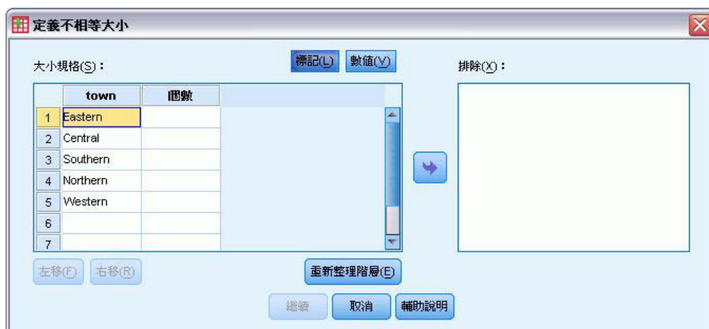
圖 2. 「定義不相等大小」對話框