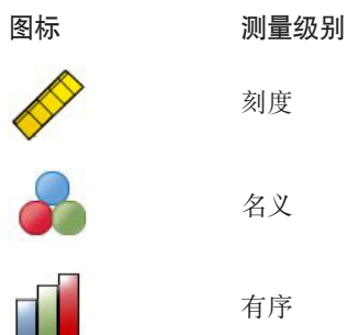
表 1. 测量级别图标.

可以暂时更改变量的测量级别，方法是在源变量列表中右键单击该变量，然后从弹出菜单中选择测量级别。