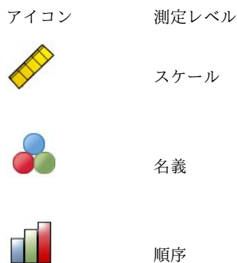
表 1. 測定レベル・アイコン:

ソース変数リストの変数を右クリックし、ポップアップ・メニューから測定レベルを選択することにより、その変数の測定レベルを一時的に変更できます。