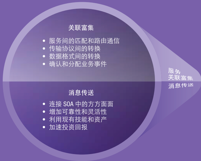
企业服务总线解决方案有两个主要功能区，即关联富集和消息传送。

“IBM 是市场中唯一一家同时具有用于复杂路由和转换的传输层和消息代理层的供应商。使用 [WebSphere] MQ 和 [WebSphere] Message Broker [软件]后，我们从未丢失过信息，并对店里的商品非常满意。IBM 为我们提供及时可用的集成产品，令构建企业服务集成总线更加简便，因为只需 IBM 一家供应商便可提供总线所需的各种层。IBM 能够提供经济高效的集成解决方案，并使 BCBS of Kansas City 这种较小的市场计划都卓有成效。”