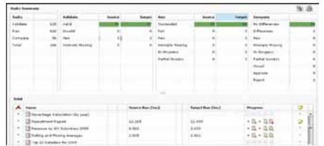
图 3. IT 人员通过 Flash 任务摘要报告能快速查看在两个环境下生成的报告结果。

屏幕底部的总计 (Total) 部分显示了个别报告状态和所有相关备注。其中也显示了报告在两个环境下的执行时间。