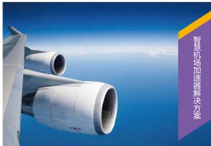
智慧机场加速器解决方案