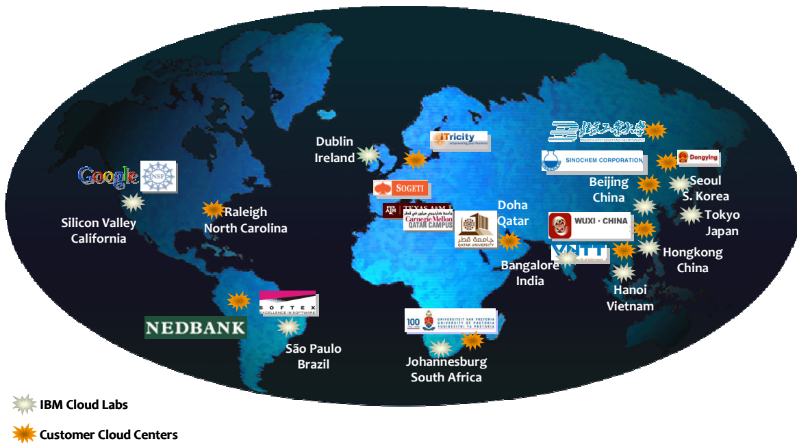
IBM 云计算中心全球示意图