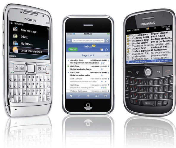
Obrázek 3: K datům uloženým v aplikacích Lotus Domino můžete přistupovat z řady mobilních zařízení.

— Tatjana Vasiljeva, vedoucí oddělení vývoje informačních systémů, SEB Latvia