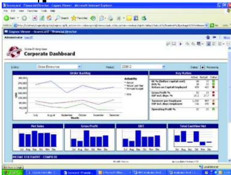
Acoperire complet a raportului