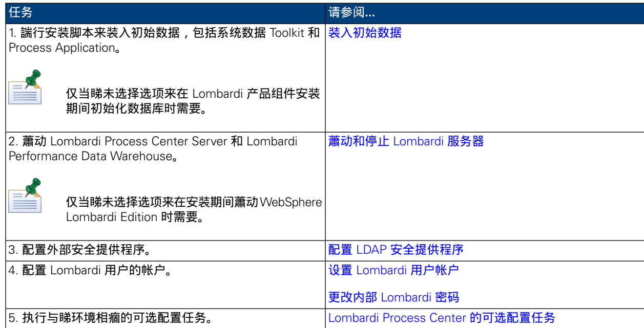
表 3. 安装后配置