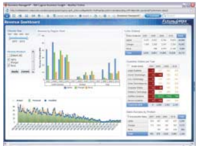
차트, 크로스 탭과 목록 등 다수의 보고서 객체와 IBM Cognos Business Insight를 이용하는 BI 컴포넌트를 이용하여 보고서를 생성할 수 있습니다.

Cognos BI 보고 소프트웨어로, 비즈니스 사용자들은 최소의 교육이나 IT 지원으로 보고서를 작성하고, 수정하며 공유할 수 있습니다. 태스크 기반의 인터페이스는 리포팅에 소요되는 시간을 단축하고, 직원들이 신뢰할 수 있는 기업 정보를 이용하여 자신만의 통찰력을 확보할 수 있게 됩니다.