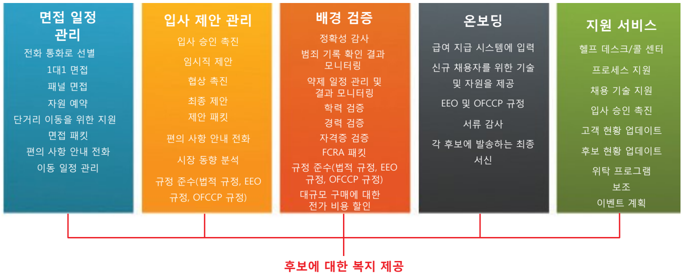
그림 3 IBM의 툴을 이용해 채용 프로세스가 진행되는 동안 준비를 하고, 일정을 관리하고, 후보에 대한 복지를 제공할 수 있습니다.