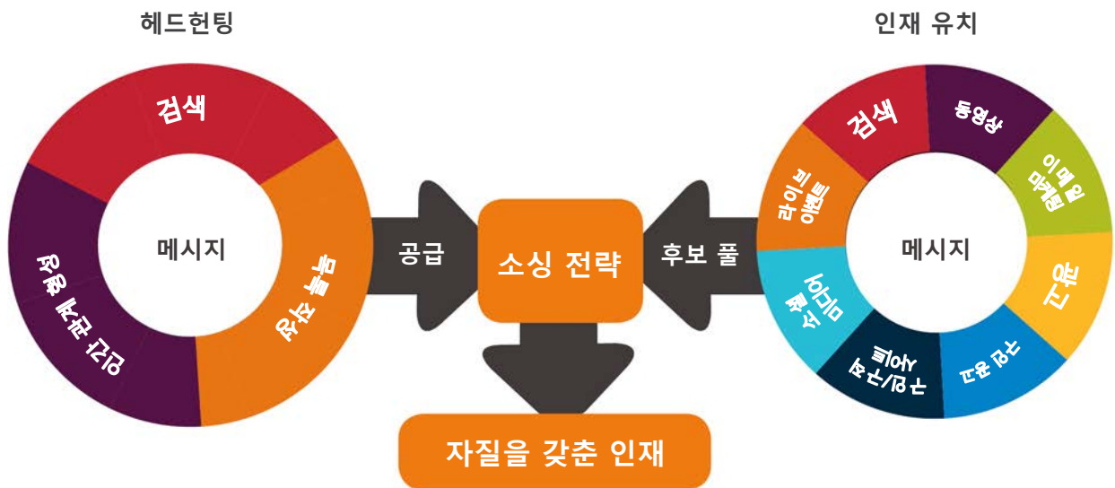
그림 2. 헤드헌팅 기법 및 인재 유치 메커니즘을 이용한 효과적인 소싱 전략

우수한 인재를 소싱할 수 있는 곳은 많지만, 각 기업의 비즈니스에 적합한 메커니즘을 파악하는 것은 어려운 일입니다. IBM은 우수한 인재를 찾기 위한 헤드헌팅과 인재 유치 작업의 결합을 통해 최상의 인재를 쉽고 빠르게 발견하고, 유치하고, 이들과 연결할 수 있는 유연성을 제공합니다. 헤드헌팅 기법으로 발견된 인재 공급원을 이용하든, 인재 유치 메커니즘으로 생성된 후보 풀을 이용하든, 우수한 소싱을 위해서는 중심점에서 적절한 메시지와 전략을 결합해야 합니다.