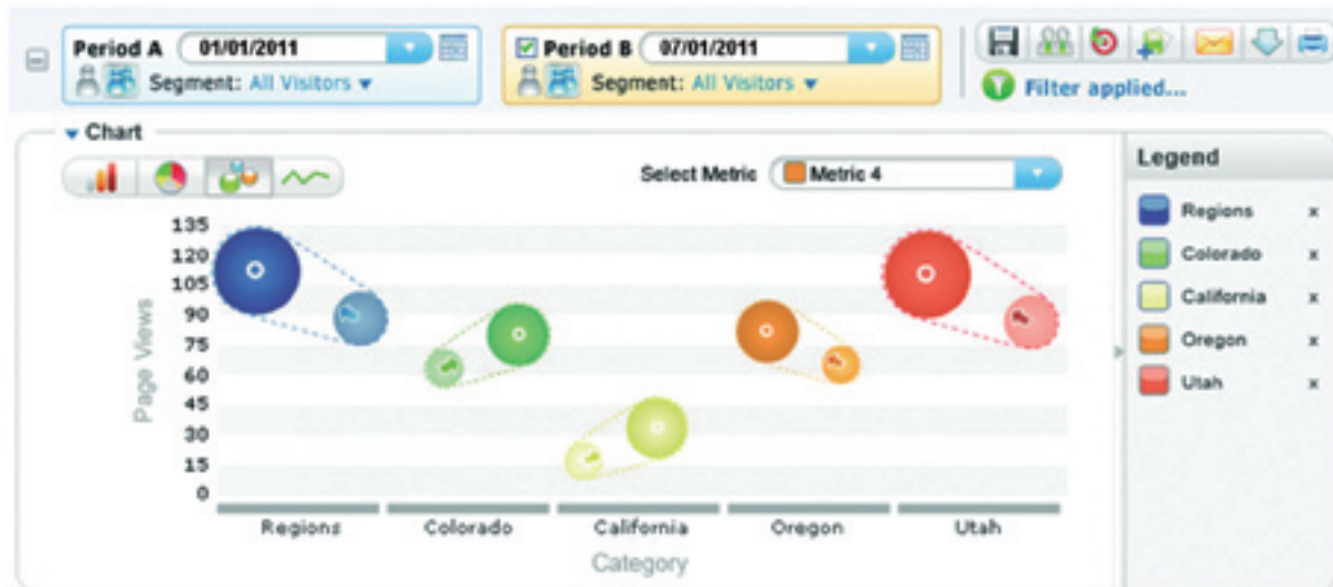
圖4：直覺式圖表將趨勢視覺化，繪出重要行銷見解。