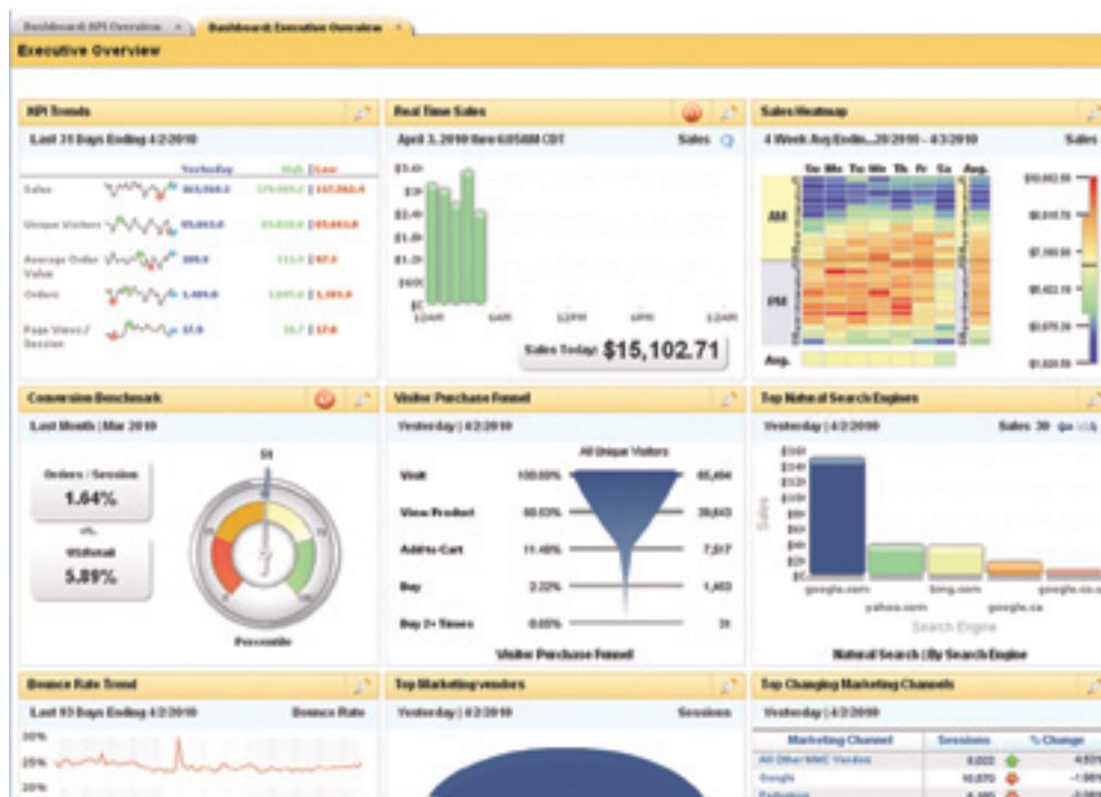
圖2：彈性的儀表板於單一整合檢視畫面即時提供指標。