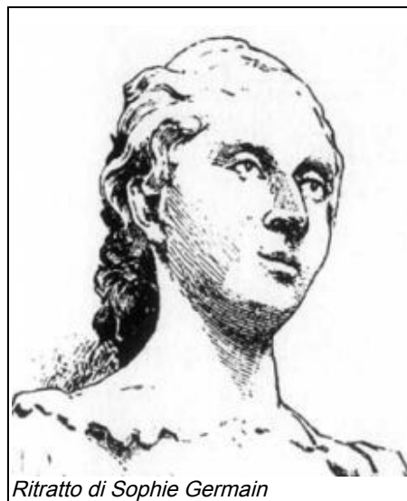
Ritratto di Sophie Germain

Dopo i progressi di Euler per circa cinquanta anni non ci furono miglioramenti nonostante l'ultimo teorema fosse diventato il problema più famoso della teoria dei numeri. Questa situazione mutò radicalmente grazie a Sophie Germain. Sophie Germain nacque nel 1776 e morì nel 1831 e per tutta la vita dovette scontrarsi contro il pregiudizio. Nella sua società non era pensabile che una dama della buona società si dedicasse ad argomenti come la matematica, ma Germain quando era piccola lesse un libro di storia della matematica e rimase affascinata dalla morte di Archimede. La leggenda narra che quando un soldato romano andò a chiamare Archimede per condurlo davanti al centurione questo si rifiutò di seguirlo essendo assorto in un problema geometrico e il soldato quindi trafisse Archimede. La Germain fu talmente colpita dal fatto che un uomo potesse perdere la vita per la matematica dal decidere di studiarla. Inizialmente la sua decisione fu molto avversata dal padre ma con il trascorrere