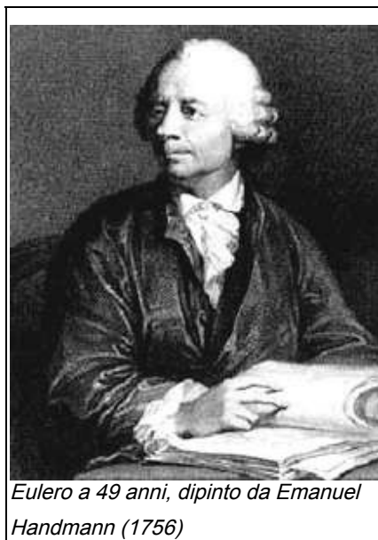
Eulero a 49 anni, dipinto da Emanuel Handmann (1756)

La pubblicazione degli scritti di Fermat aveva generato tra i matematici opinioni contrastanti. La maggior parte ne riconosceva l'utilità ma il fatto che la maggior parte dei teoremi fosse senza dimostrazione o con dimostrazioni incomplete ovviamente ne riduceva l'utilità immediata anche se alcuni matematici presero i teoremi come delle sfide da affrontare e vincere. Molti furono affrontati e risolti ma quello che in seguito sarebbe stato chiamato l'ultimo teorema resisteva a qualsiasi tentativo di assalto. I primi risultati li ottenne Leonhard Euler un secolo dopo Fermat. Euler (in Italia noto come Eulero) era un matematico svizzero nato nel 1707 a Basilea e morto nel 1783 a San Pietroburgo. Inizialmente Euler doveva diventare un teologo ma Johann Bernoulli si rese conto delle straordinarie capacità del ragazzo e convinse il padre a far diventare Leonhard un matematico. Questa fu un'enorme fortuna per la matematica dato che i contributi di Euler spaziano in talmente tante aree della matematica e sono talmente profondi da rendere Euler uno dei maggiori matematici del XIX secolo se non addirittura il maggiore. Euler analizzando