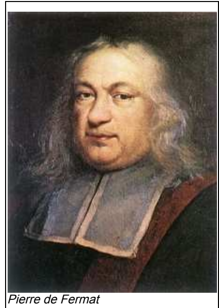
Pierre de Fermat

Pierre de Fermat era un magistrato francese vissuto tra il 1601 e il 1665. Sebbene il suo lavoro di magistrato fosse molto impegnativo, Fermat trovò il tempo per dedicarsi in modo molto proficuo allo studio della Matematica. Pur non essendo di formazione un matematico professionista Fermat diede importanti contributi nello studio di funzioni e nella teoria dei numeri. Fermat intratteneva una stretta corrispondenza con diversi matematici dell'epoca, ma un suo naturale riserbo insieme a una notevole riluttanza nel rendere note le sue scoperte fecero sì che il suo genio venne scoperto molto tempo dopo la sua morte, quando il figlio decise di raccogliere la carte del padre e di renderle pubbliche. Il famoso enigma venne ideato da Fermat mentre studiava l' Arithmetica di Diofanto di Alessandria, matematico vissuto tra il 212 d.C. e il 298 d.C. e che spesso viene chiamato padre dell'algebra per le sue scoperte. Il libro di Diofanto raccoglieva molte dimostrazioni eleganti di problemi a soluzioni intere che i matematici avevano affrontato nel corso dei secoli; leggendo la parte legata alle terne pitagoriche, si suppone che Fermat abbia avuto l'idea di estendere l'esponente da 2 ad un generico n . Fermat scrisse in una nota del libro l'enunciato del suo famoso teorema e poi aggiunse: