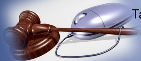
Таблица 1 Зарубежные интернет-аукционы

В табл. 1 представлены характеристики наиболее широко известных зарубежных интернет-аукционов.