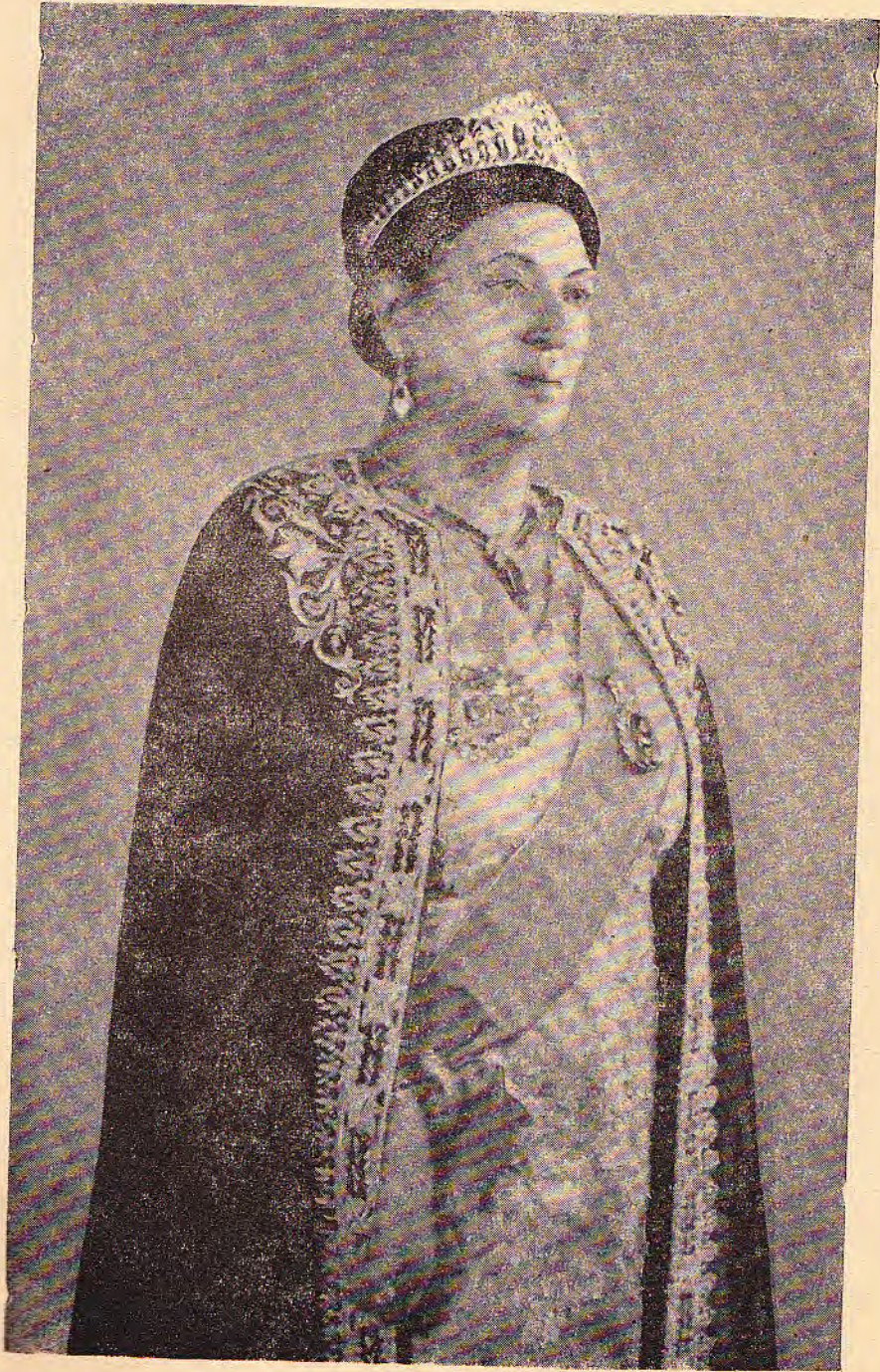
ግርማዊት ኦቲን መንን ።