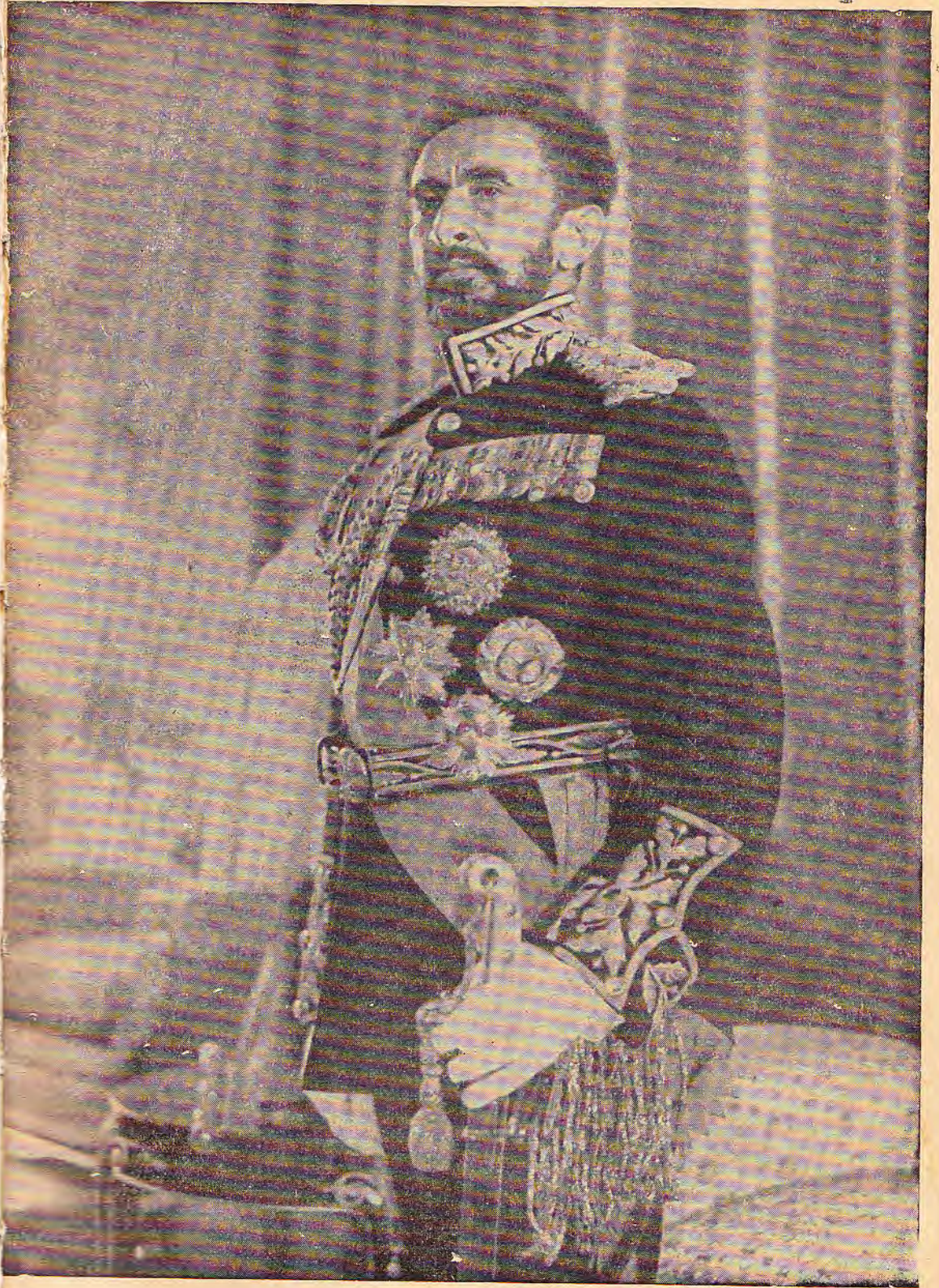
ገርግዊ ቀዳማዊ ኃይለ ሥላሴ ንጉሠ ነገሥት ዘኢትዮጵያ ም