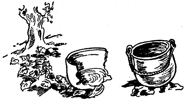
የብረት፡ ድስትና፡ የሸክላ፡ ድስት።

አንድ፡ ቀን፡ ብረት፡ ድስት፡ ሸክላ፡ ድስትን፡ አለው። እኔን፡ ነው፡ በሁሉም፡ መልክህ፡ የሚመስለው። ወንድሜ፡ ነህ፡ እኮ፡ ባታውቀው፡ ነው፡ እንጂ፤ ከዛሬ፡ ጀምሮ፡ እንሁን፡ ወዳጄ። እኔን፡ እንደ፡ መቅረብ፡ መሸሸህ፡ ለምን፡ ነው? አካሌ፡ አካላትህ፡ የኔ፡ ቤት፡ ያንተም፡ ነው። አሁንም፡ በል፡ ተነሥ፡ ፍቅራችንም፡ ይጥና፤ ሽር፡ ሽር፡ እያልን፡ እንናፈስና። መፋቀራችንን፡ ይይልን፡ ሰው፡ ሁሉ፤ የግንተዋወቅ፡ ለምን፡ ነው፡ መምሰሉ። አጥቂ፡ ቢመጣብህ፡ ዘሎ፡ የሚግታ፤ እኔ፡ እሆንሃለሁ፡ ጎይለኛ፡ መከታ፤ ለፀሐይ፡ ላባራው፡ እየሆንኩህ፡ ድንኳን፤ እደግናሃለሁ፡ ቢያነቅፍህ፡ እንኳን። በደካማነት፡ ቅር፡ እያለው፡ ሆኗ። ተነሣ፡ ሸክላ፡ ድስት፡ አንድነት፡ ሊሄዱ፤ አንድ፡ መቶ፡ እርምጃ፡ እንደ፡ ተራመዱ፤