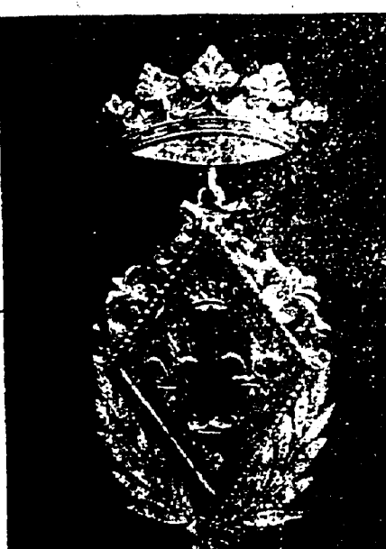
Dessin de la médaille d'or offerte par l'Académie de la Nouvelle-Orléans pour la meilleure composition française.