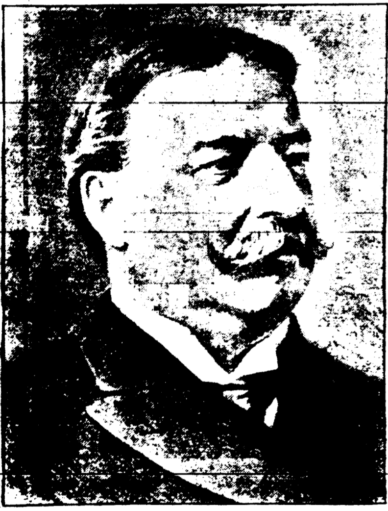
M. W. H. TAFT.