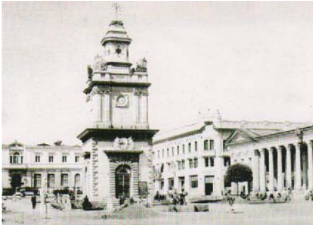
Al fondo de izquierda a derecha: Banco de Occidente, Edificio Rivera y Municipalidad de Quetzaltenango, al centro la Torre del Sexto Estado (1938).

En el año de 1982 un incendio de grandes proporciones consumió el interior del edificio, que en su totalidad era de madera importada de San Francisco California, Estados Unidos; sin embargo la fachada de cemento “portland” soportó el siniestro.