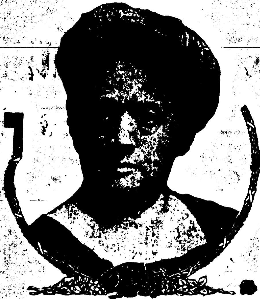
WILLIAM JENNINGS BRYAN