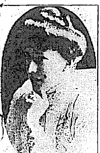
S. M. la reine ELISABETH.

Le mariage ordinaire a été, pour la circonstance, entièrement transformé et somptueusement orné. Ce ne sont que plantes à feuillage vertes, il n'y a pas de fleurs. Les tables sont garnies de tapisseries et de salons d'entrée, de escalier monumental, une horde de lanciers aux pennons surmontés de la flamme tricolore.