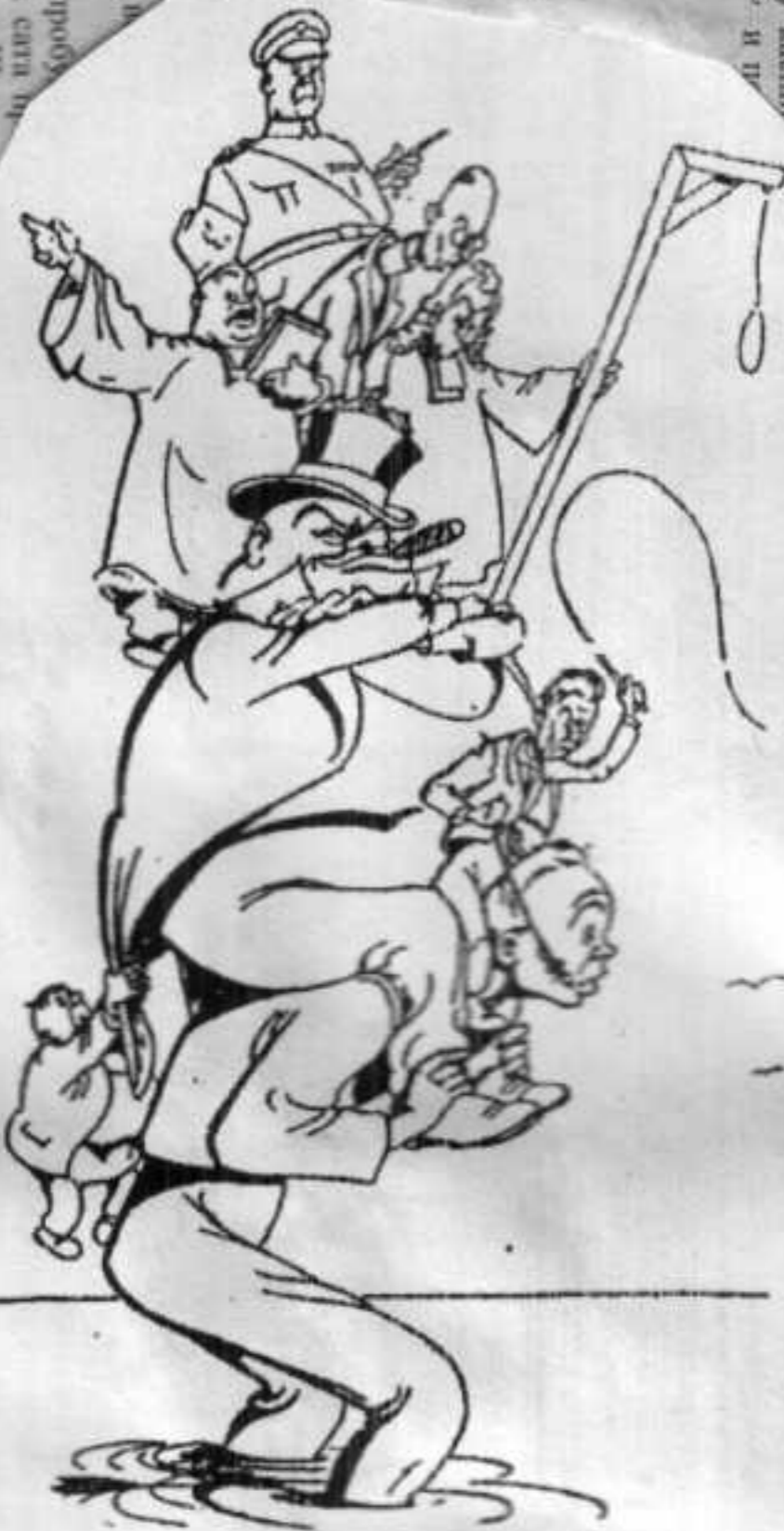
Zašto ih jednostavno ne skineš s kurca?