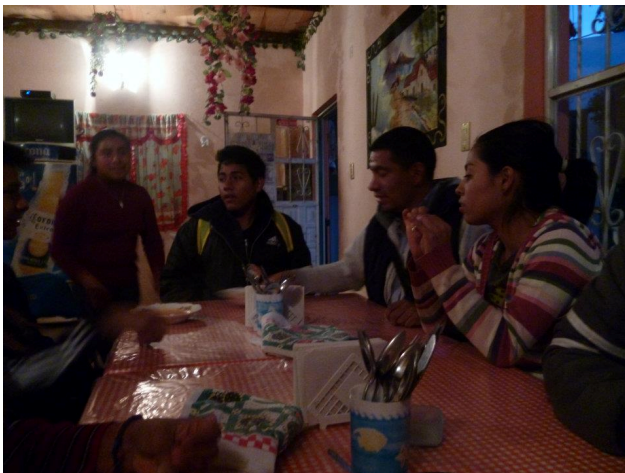
Comiendo algo antes de salir a repartir la ropa