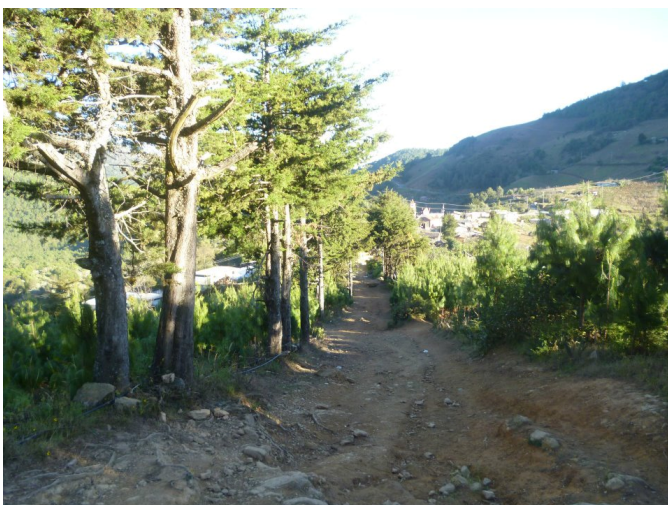
De Camino así las Juntas Auxiliares (Donde Se Repartiera la Ropa)