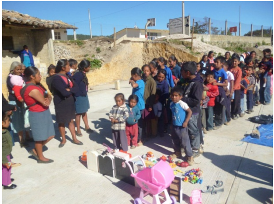
Repartimiento de Cosas