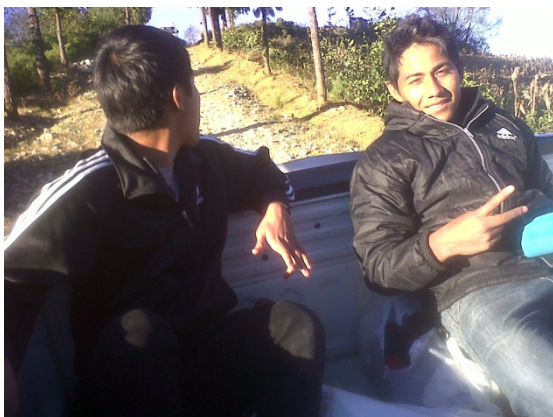
De camino a las 3ª Estación