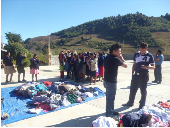
1ra Estación Grupo de 5to Semestre