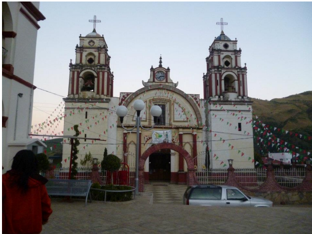
Llegada al municipio de Coyomeapan