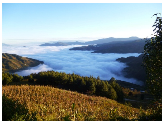
Paisajes que se podían admirar de regreso