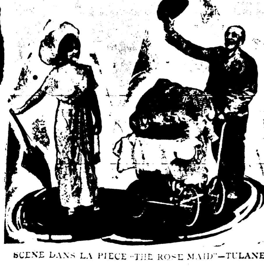
SCENE DANS LA PIECE "THE ROSE MAID" - TULANE