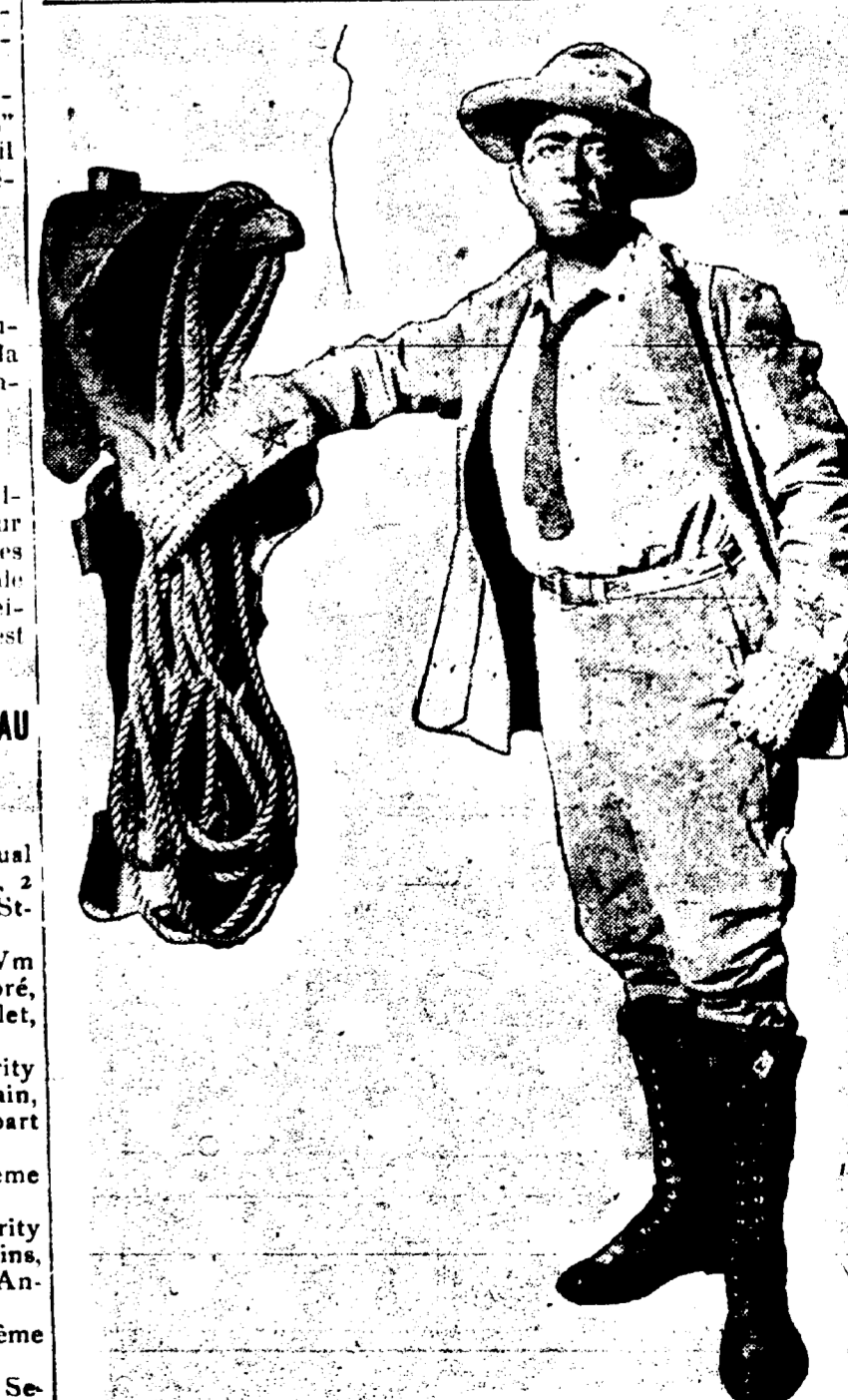
SCENE DE "WHERE THE TRAIL DIVIDES", AU CRESCENT.

ALBERT CADESSUS, Prop. Phone-Main 3751. Nouvelle-Orléans 28 oct-12