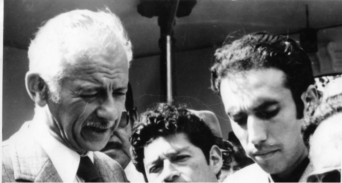
ENTREVISTA AL CANDIDATO PRESIDENCIAL SIXTO DURAN BALLEEN.-1.979.-EDUARDO PAREDEZ DE RADIO LATAACUNGA - ARCHIVO PAREDES BAUTISTA.

AL NORESTE LATAACUNGUENO, CON BIZARRIA DE VARON NEVADO, HALLASE EL ACTIVO COTOPAXI , REY DE LOS MONTES, SEÑOR DE LAS ALTURAS, GUARDIAN ETERNO DEL VALLE SERRANIEGO.