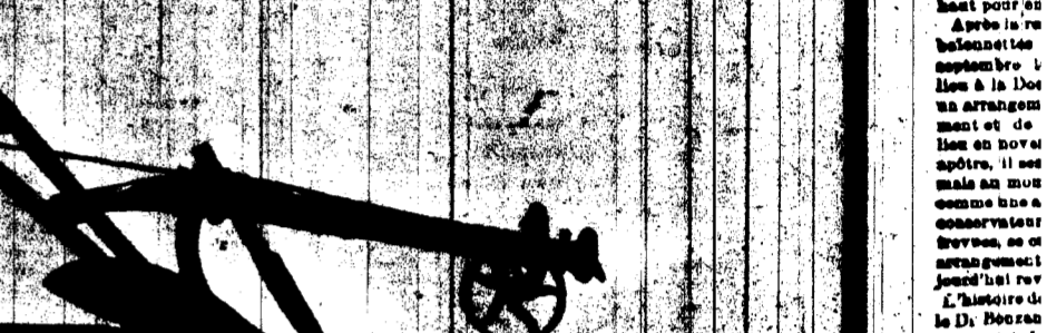
CHARRUE N. 70-0 POUR TERRES À SUCRE, TRANCHANT EN AIGES DE 10 POUCE.

La simplicité de ses charrettes et de ses charrues, les rendent indispensables.