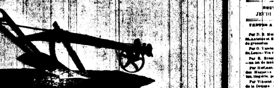
CHARRUE N. 40-0 POUR TERRES À SUCRE, TRANCHANT EN AIGES DE 8 POUCE.

La simplicité de ses charrettes et de ses charrues, les rendent indispensables.