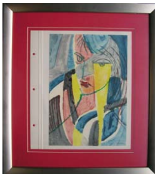
Figura 2. Señorita descontenta. 1929

Es una generación inspirada e instruida por la vanguardia europea de su tiempo. Desde los constructivistas rusos, como por ejemplo Tatlin o Malevic, pasando por el expresionismo alemán más dramático de Max Beckman, hasta fauvismo afectivo de Henry Matisse, o el lirismo eslavo de Marc