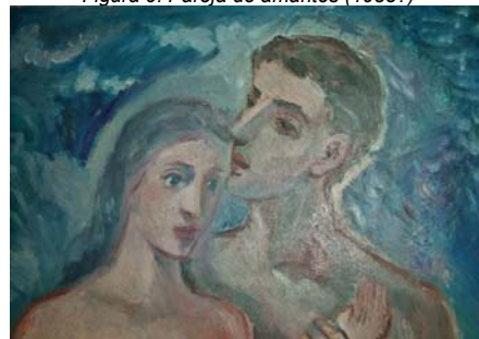
Figura 9. Pareja de amantes (1935?)

Con esta organización de los personajes Beran busca resaltar el ideal femenino: son mujeres de grandes y expresivos ojos azules; finas y sensuales, aunque no exentas de fortaleza como corresponde al ideal de