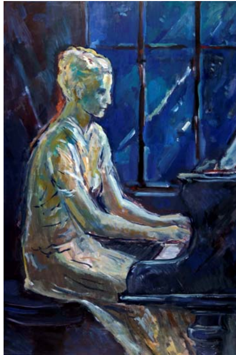
Figura 48. Nocturno (1988)

En 1990, a causa de una enfermedad incurable, muere rodeado de los suyos y de sus recuerdos, con la esperanza de volver a escuchar aquellas baladas privadas que su querida Vera le interpretaba en las largas noches del invierno moravo.