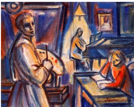
Figura 29. El pintor y su familia (1954?)

La maternidad en estos años es colorida, nada que ver con la paleta de negros y grises que presidía las madres aterradas de la etapa bélica. Ahora son madres realizadas y protectoras, de mirada limpia y semblante feliz.