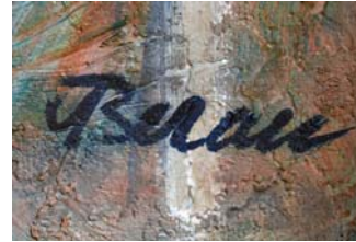
Figura 1. Detalle con la firma del autor.

El nacimiento de Aljo Beran en Cracovia fue un acontecimiento circunstancial. Su padre era oficial del ejército imperial y, por entonces, estaba destinado en dicha ciudad. Sin embargo, su verdadera referencia, donde se encuentran las raíces de su familia, es Olomouc, ciudad ubicada en el centro de la región checa de Moravia. En Olomouc el pintor vivirá más de cincuenta años: allí ejercerá el magisterio, encontrará una parte importante de sus temas y será públicamente reconocido.