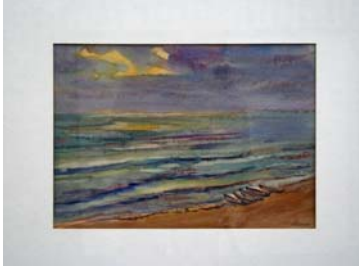
Figura 35, 36, 37. Cuadros del último viaje al Báltico y al mar Negro (1964-66)

A mediados de los años 60 Beran visitará de nuevo costas europeas muy queridas. Viaja otra vez al Báltico y la serie de óleos que produce fruto de aquel viaje los denomina la Costa de la paz . Con ello quería resaltar que aquel mar que años atrás había separado a dos enemigos irreconciliables (Alemania y Polonia) era de nuevo compartido una vez desterrado el fantasma de la guerra.