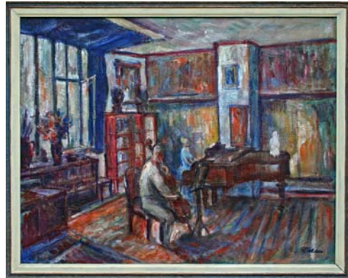
Figura 14. Ensayo (1944)

Vera fue su gran amor y durante toda su vida también será su musa privada a la que dedicará decenas de cuadros. Muchos de ellos reflejan su faceta profesional: Vera sentada al piano en el amplio apartamento del centro de Olomouc donde compartieron su vida.