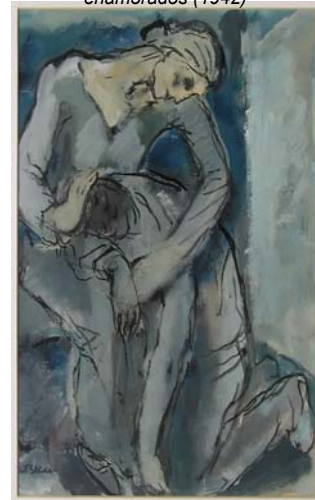
Figura 13. Pareja de enamorados (1942)

En estas composiciones los enamorados no muestran posturas galantes o despreocupadas de los primeros años. Al contrario, las imágenes muestran novios que se despiden, parejas llorosas y compungidas, abrazándose con desesperanza.