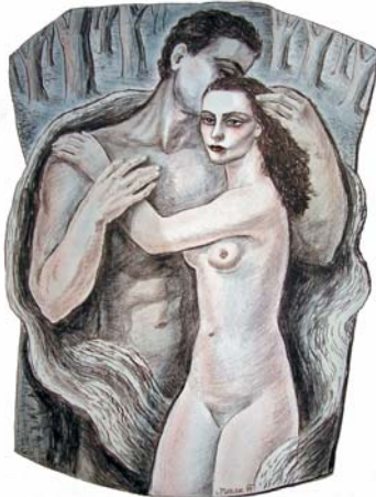
Figura 10. Pareja de amantes (1937?)

Después de terminar su periodo de formación, en 1935 Beran vuelve a la ciudad de sus antepasados, Olomouc. Es contratado como profesor de dibujo en un Gymnasium 2 de la ciudad, pero en marzo de 1939, en señal de protesta por la invasión alemana de Checoslovaquia, abandona las aulas para centrarse en la pintura.