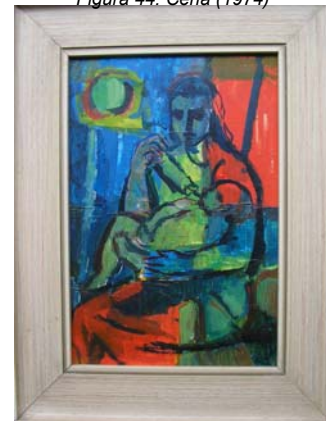
Figura 44. Cena (1974)