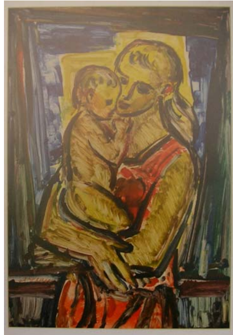
Figura 46. La pequeña Sasa (1986)