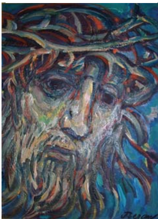
Figura 12. Cristo doloso

En los años de la guerra Beran ensaya otro personaje nuevo: el Cristo Doloso. Seguramente es el personaje que mejor refleja la barbarie humana. Se trata de un Jesucristo de perfiles angulosos y expresión abatida y angustiada.