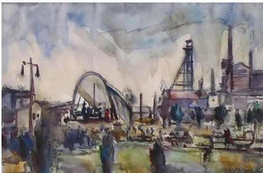
Figuras 20 y 21. Pintura representativa del realismo socialista. (Entre 1946 y 1950). Beran interpreta esta corriente de forma muy personal y los trabajos no pueden encuadrarse dentro de una línea realista en sentido estricto.

Hay, sin embargo, una segunda razón que puede apuntarse en el descenso de la producción artística: durante esa época el "arte oficial", es decir, la corriente dominante dentro del panorama artístico de Checoslovaquia es el realismo socialista con el que Beran no estaba totalmente de acuerdo.