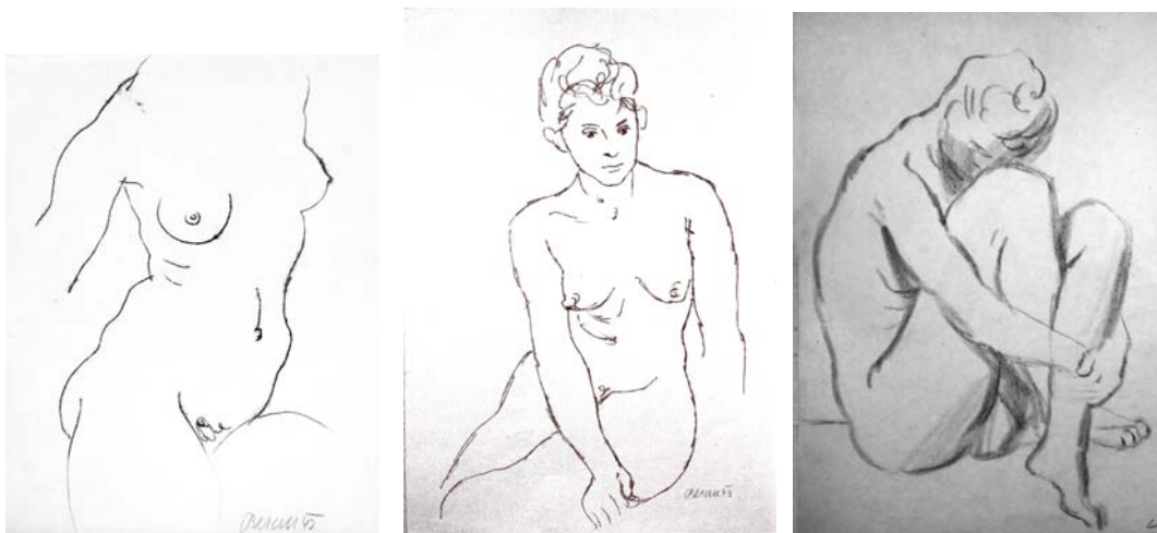
Figuras 15, 16 y 17. Selección de obra gráfica y pintura de Aljo Beran dedicada a su mujer en la década de los 40. Estas obras fueron descubiertas después de la muerte del pintor. En la colección privada de Beranova hay centenares de este tipo de composiciones

Durante toda la década de los 40 Beran realizó decenas de composiciones, la gran mayoría obra gráfica, donde el único motivo era el cuerpo desnudo de su joven esposa. Es fácil imaginar la pareja en su intimidad: ella interpretándole canciones de amor, él pintándola en la plenitud de su juventud, ambos amándose.