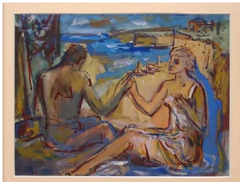
Figura 6. Amantes en el Adriático (1937).