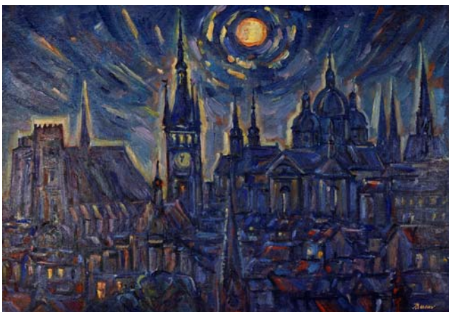
Figura 39. Olomouc nocturno (1974)

Sedlak (1974), en su libro titulado Olomouc en el arte de Aljo Beran , afirma que este autor representa mejor que ningún otro a la generación de pintores nacidos a principios del siglo XX que han dedicado su obra a Olomouc. En la década de los 70 Beran llevaba más de cuarenta años trabajando en dicha ciudad y había participado activamente en la promoción cultural y