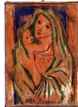
Figura 30. Vera Beranová (1947)

La maternidad en estos años es colorida, nada que ver con la paleta de negros y grises que presidía las madres aterradas de la etapa bélica. Ahora son madres realizadas y protectoras, de mirada limpia y semblante feliz.