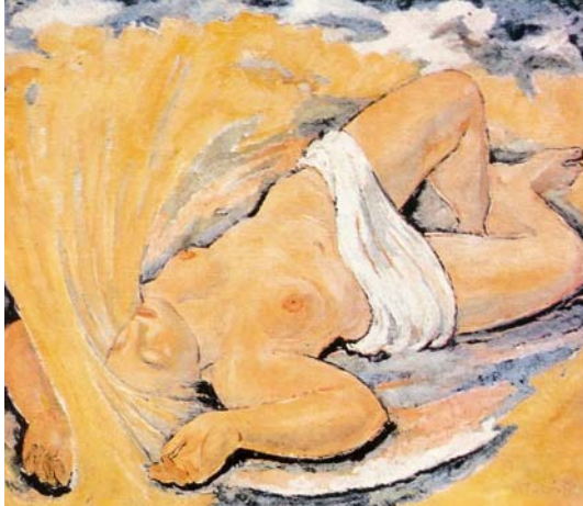
Figura Nº 18. Hana (1936)

En esta primera época Aljo Beran pintó dos cuadros que merecen un comentario particular. Uno de ellos, realizado en 1936, tiene por título Haná 3 . Se trata de trabajo peculiar, algo nuevo en la pintura de Beran que nunca más volverá a ensayar. Hana es una obra alegórica donde un motivo figurativo –en este caso el desnudo femenino– sirve de pretexto para resaltar la fertilidad y belleza de la campiña morava. La obra fue presentada públicamente en 1937 y originó cierta controversia. La crítica más feroz alegó dudosa oportunidad y escaso