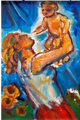
Figura 45. Madre e hija