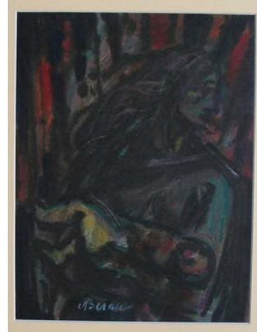
Figura 11. Madre aterrada (1942)

Mujeres de caras demacradas o expresiones desencajadas que huyen entre alambradas y ciudades ardiendo con su pequeño vástago, a veces inerte, en brazos. Es una pintura tétrica donde las mujeres reflejan incredulidad y desesperación ante la sinrazón de la guerra. Las madres aterradas son composiciones negras, donde el rojo, que representa el fuego destructor, sólo añade un punto histriónico. Los trazos se vuelven más gruesos al nacer de una pincelada rabiosa.