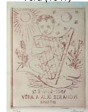
Figura 28. El nacimiento de Vera (1947)

Este hecho marca un nuevo enfoque para un tema ya tratado en épocas anteriores: la representación de la maternidad. Sin embargo, las madres de estos años nada tienen que las madres aterradas de los años bélicos. Son obras llenas de color, donde cada uno de los detalles relacionados con la maternidad –la lactancia, el cuidado, la educación- se convierten en motivo de fiesta y celebración.