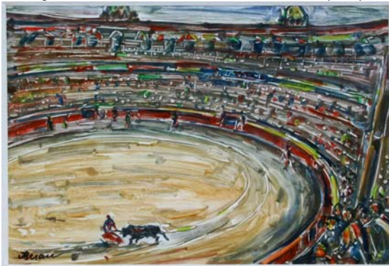
Figura 43. Corrida I. Plaza de Toros de Barcelona (1978)

En dicho viaje también asistió a una corrida de toros en la plaza de Barcelona. Aunque, según la hija del pintor, el espectáculo no fue del agrado de su mujer, Beran quedó impactado con la "fiesta nacional" llegando a realizar dos monotipos sobre el tema.