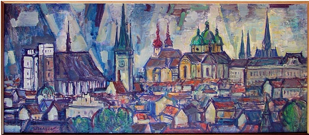
Figura 38. Panorámica de Olomouc (1970)

Olomouc, ciudad milenaria, monumental y de gran riqueza cultural, está ubicada en el corazón de la región de Moravia y es una de las ciudades más importantes de la República Checa. Su patrimonio artístico y arquitectónico ha sido fuente de inspiración para numerosos maestros a lo largo de la historia de la pintura checa. Wellner, Hoplíček, Lenhart o Pelikán, entre otros, han inmortalizado los rincones de esta ciudad.