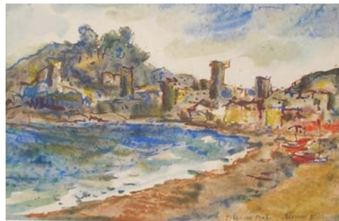
Figura 42. Tossa de Mar. Cosa Brava (1978)

Además, los cuadros de esta época también fueron adquiridos por instituciones públicas y privadas, y por