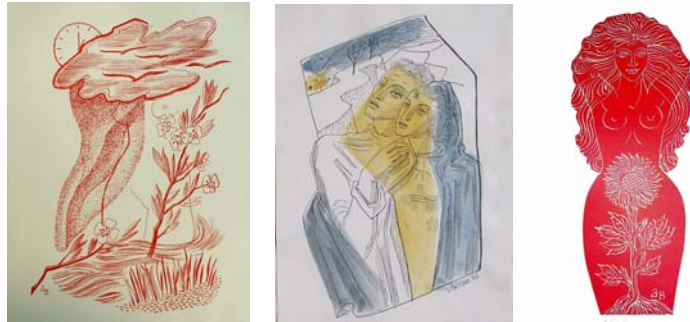
Figuras 3, 4 y 5. Los primeros trabajos de Beran estuvieron vinculados al negocio de imprenta y editorial que inició con su hermano. Aquí se muestran algunos ejemplos de ilustración de los textos

En los primeros años de su obra ya están fijados dos temas que recorrerán la pintura de Aljo Beran: por un lado, el mar y, por otro, los amantes en general y a la belleza femenina en particular.