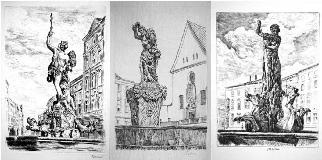
Figuras 25, 26 y 27. De izquierda a derecha grabados de la Fuente de Mercurio, Fuente de Júpiter y Fuente de Neptuno, pertenecientes al proyecto Olomoucké Kašny.

La actividad académica de Beran y las obras derivadas de su creciente reconocimiento e influencia social –escudo de la universidad, retrato del rector Fischer, los grabados dedicados a las fuentes de Olomouc, etc. son ejemplos de cómo la circunstancias históricas –en este caso la época de reconstrucción del país- se ven reflejadas en su trayectoria profesional.