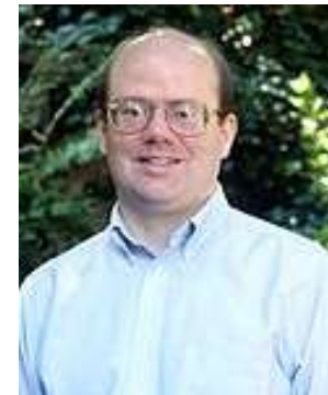
Ларри Сэнгер , предложил идею Википедии и многие из её основополагающих правил