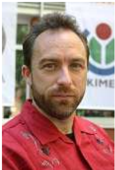
Джимми Уэйлс , основатель и лидер Википедии