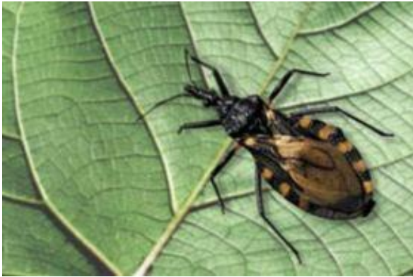
Los insectos pertenecen al grupo de animales invertebrados.

Los vertebrados son un grupo de animales con un esqueleto interno articulado, que actúa como soporte del cuerpo y permite su movimiento.