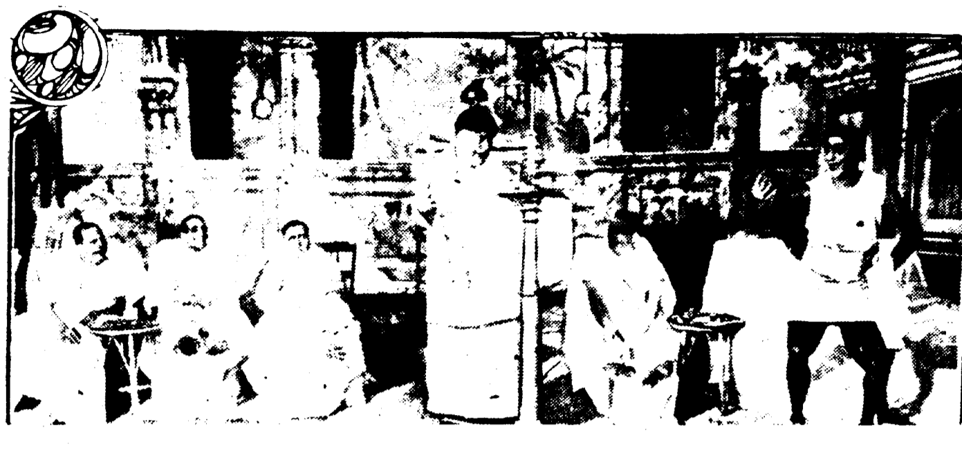
A NIGHT IN A TURKISH BAZAAR - L'ORPHÈUM.