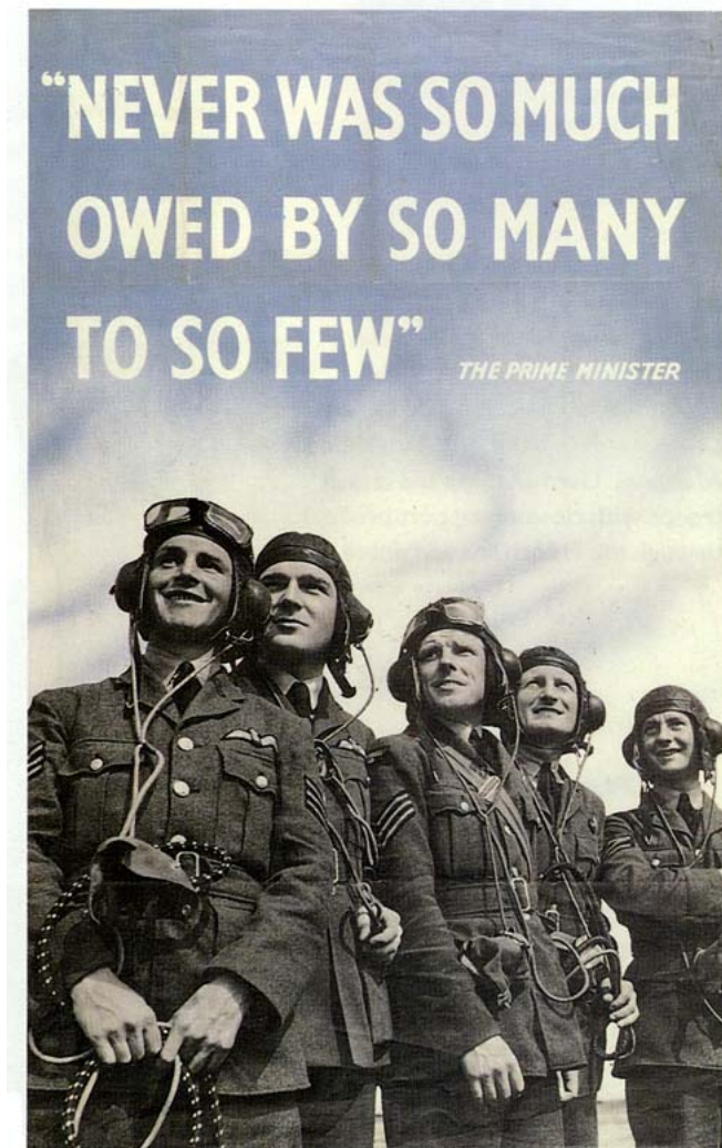
Figur 3: Propagandaplakat etter slaget om Storbritannia med Churchills berømte takk til de engelske jagerflygerne som man anså hadde reddet landet fra invasjon