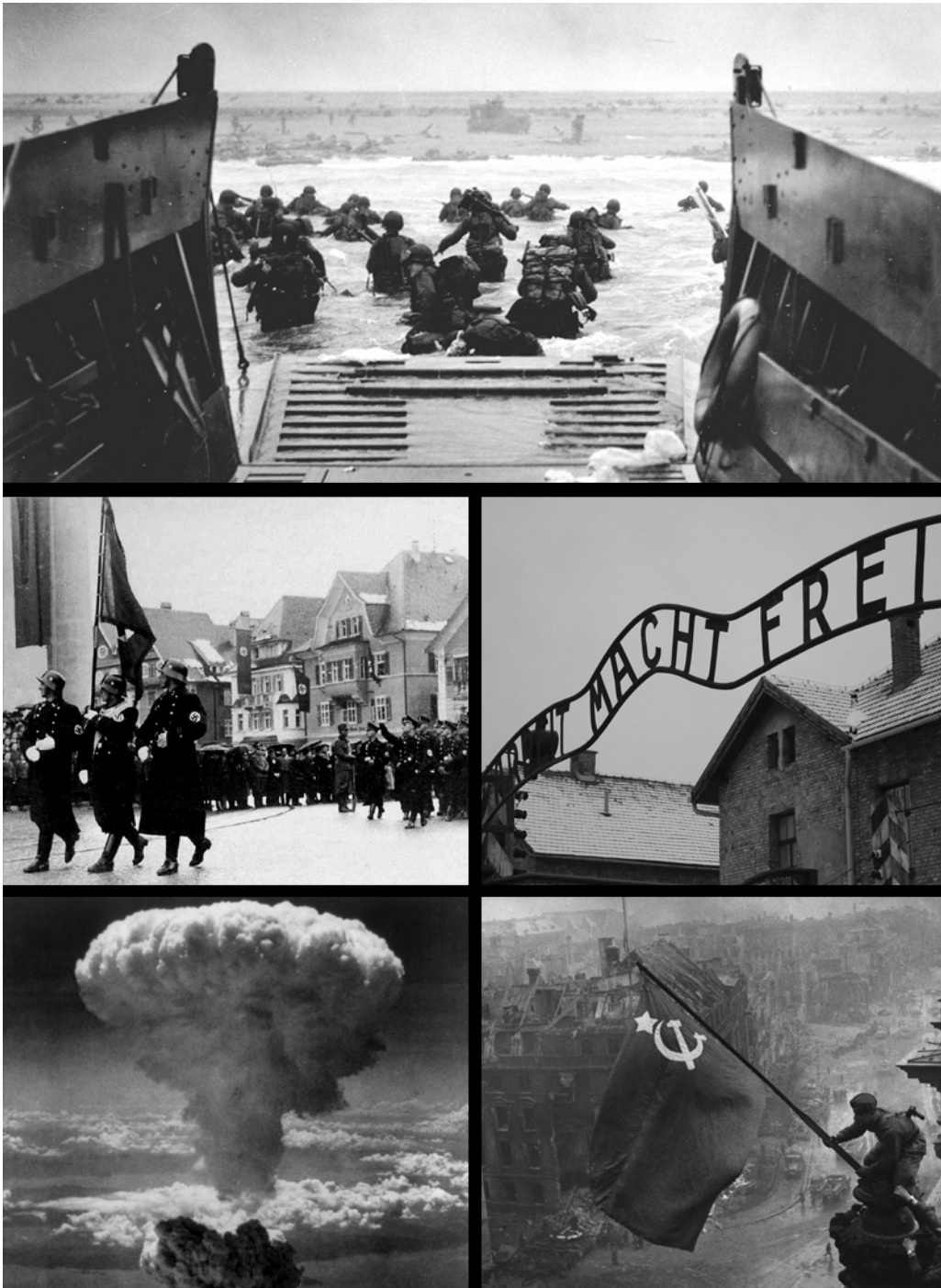
Figur 1: Fra øverst til venstre: De allierte går i land i Normandie på D-dagen. SS-tropper marsjerer i Dornbirn i Østerrike. Porten i Auschwitz. Atombomben over Nagasaki. Det sovjetiske flagget over riksdagsbygningen i Berlin