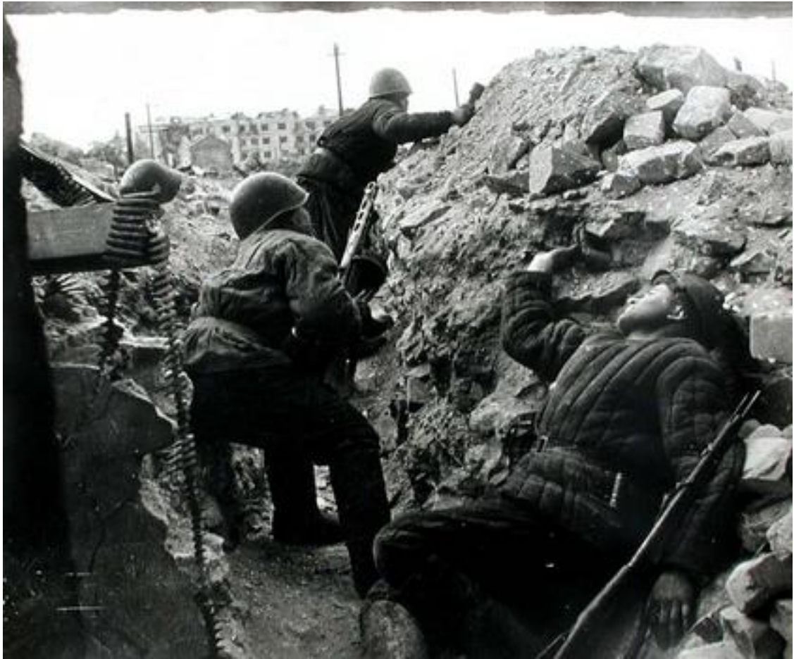
Figur 5: Sovjetiske soldater kjemper i ruinene av Stalingrad. Den sovjetiske seieren ble et vendepunkt på Østfronten under andre verdenskrig, og gjorde at Den røde armé kunne begynne på den lange veien mot Berlin.