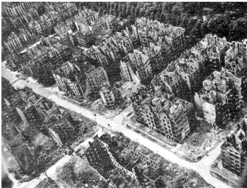
Figur 7: Hamburg etter bombeangrepene i 1943. «Operation Gomorrah» var på den tiden historiens mest omfattende bombekampanje, og gjorde over én million mennesker hjemløse.

i februar 1945 rammet bombene også Dresden i noe som var en av de mer kontroversielle hendelsene i løpet av andre verdenskrig i Europa. Bombingen av Dresden var så intens at det brøt ut ildstorm i sentrum av byen.