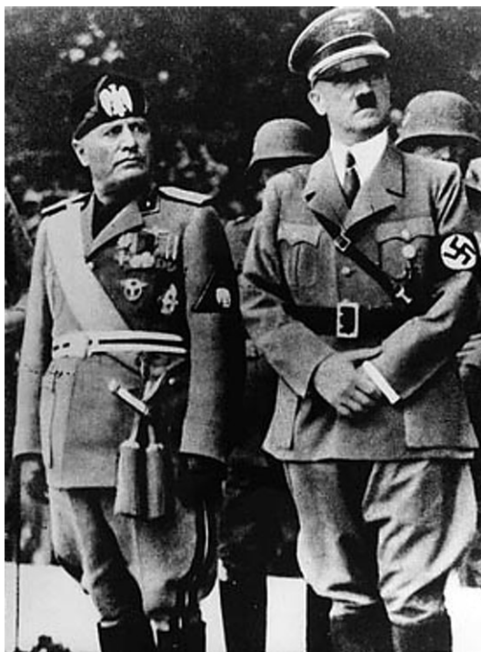
Figur 2: To diktatorer møtes i det okkuperte Jugoslavia: Til venstre Italias Benito Mussolini, til høyre Tysklands Adolf Hitler

endelig greid å trenge gjennom Mannerheimlinjen, samtidig som hjelpen fra vestmaktene lot vente på seg. I slutten av februar innledet den finske regjeringen forhandlinger om en fredsavtale, og med freden i Moskva den 7. mars måtte finnene avstå betydelige deler av territoriet til Sovjetunionen.