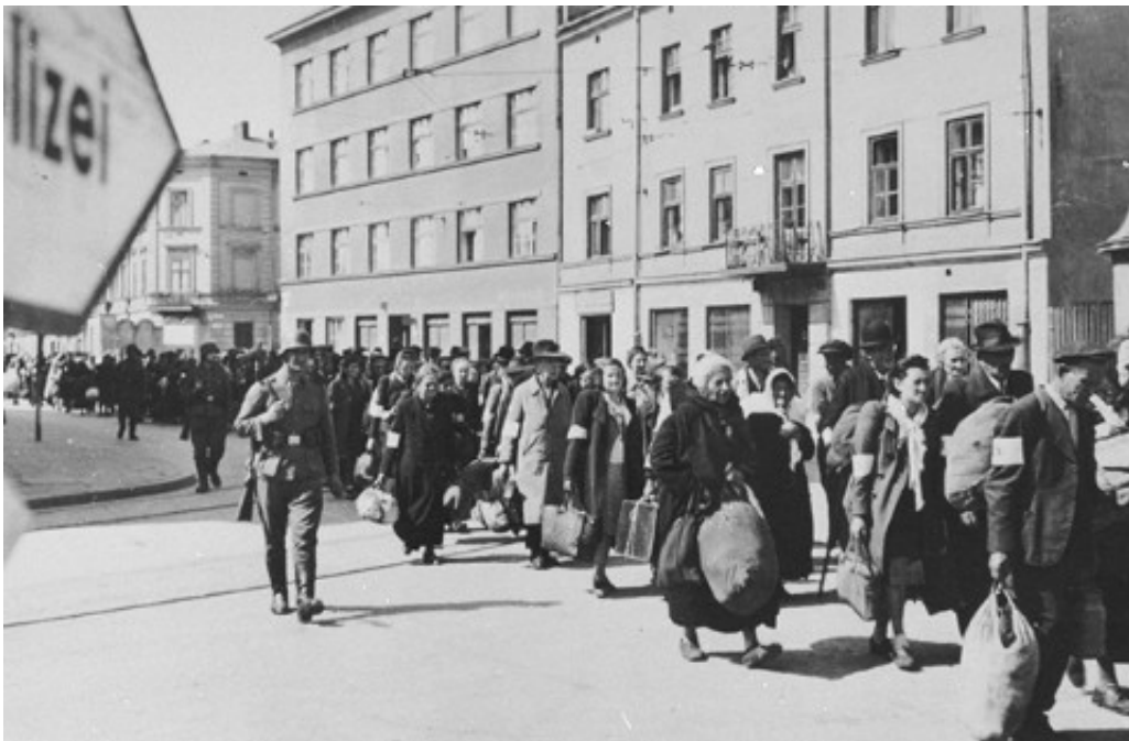
Figur 6: Jøder deporteres fra gettoen i Krakow. Polen hadde en stor jødisk befolkning før krigen, og var blant stedene som ble hardest rammet av nazistenes systematiske folkemord. Av en førkrigsbefolkning på over tre millioner omkom 90% av Polens jøder i Holocaust.