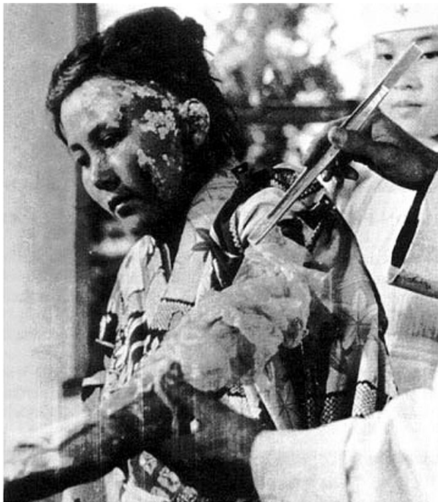
Figur 8: En sterkt skadet japansk kvinne etter det kjernefysiske bombeangrepet mot Hiroshima

Ved utgangen av året hadde 74 000 mennesker omkommet som en følge av bombingene og 83 000 som følge av Sovjets invasjon. Nå gav endelig den japanske ledelsen opp, og den 15. august kapitulerte Japan. Denne dagen markerer «V J-Day» (Victory over Japan), men først 2. september regnes andre verdenskrig for offisielt slutt, med Japans underskrivelse av kapitulasjonserklæringen ombord på slagskipet USS «Missouri».