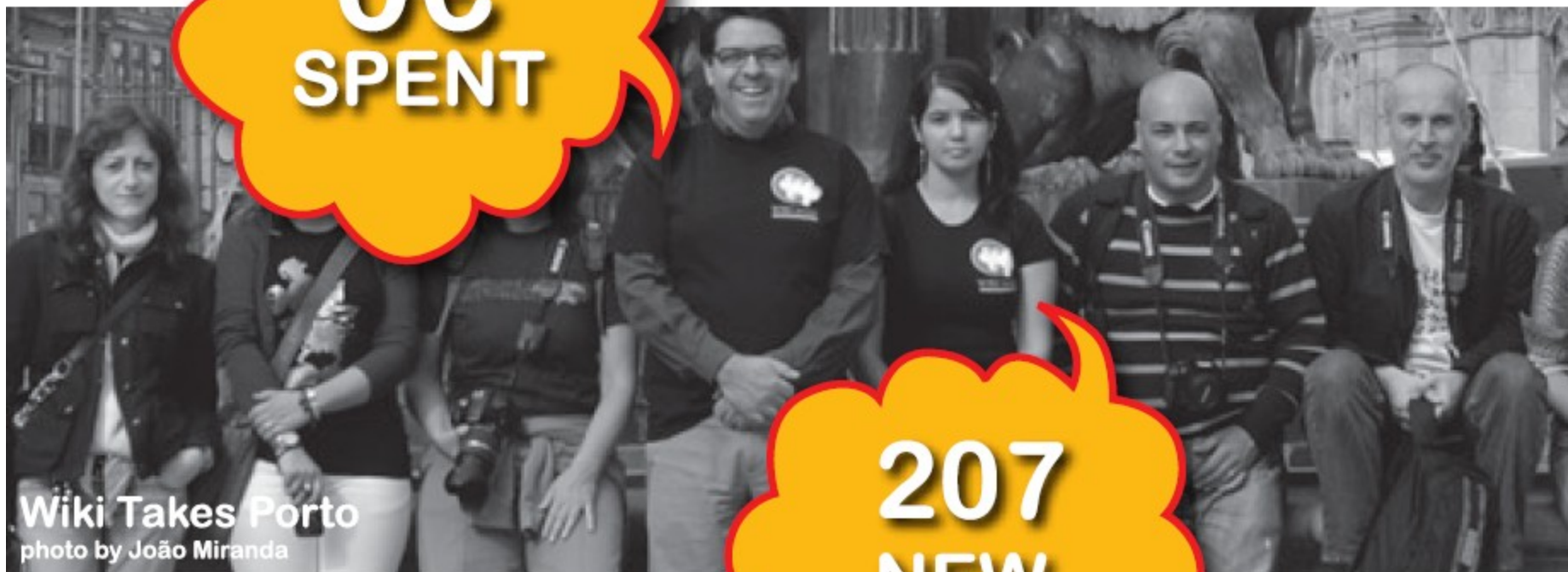
Wiki Takes Porto