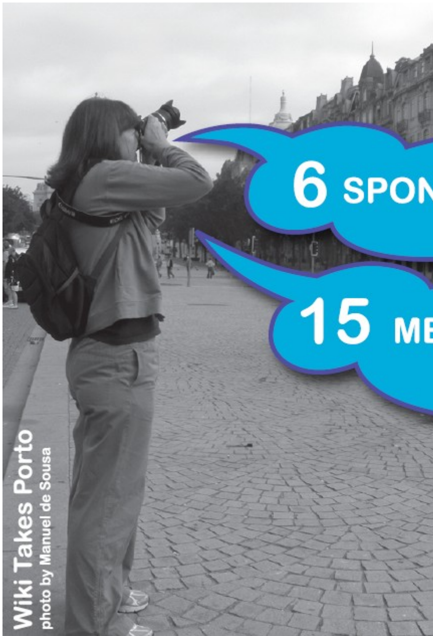
Wiki Takes Porto