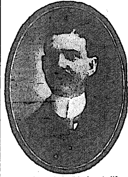
Chef du Corps des Médecins de l'Institut Médical d'Etat.

Les vieillards faibles et les hommes faibles retrouvent les forces anciennes et la puissance de la jeunesse.