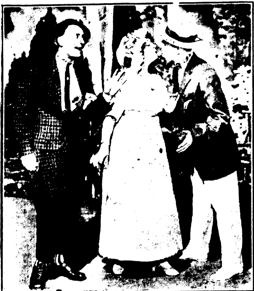
Une scène amusante dans la Nouvelle Comédie Musicale "The Echo" au Tulane.